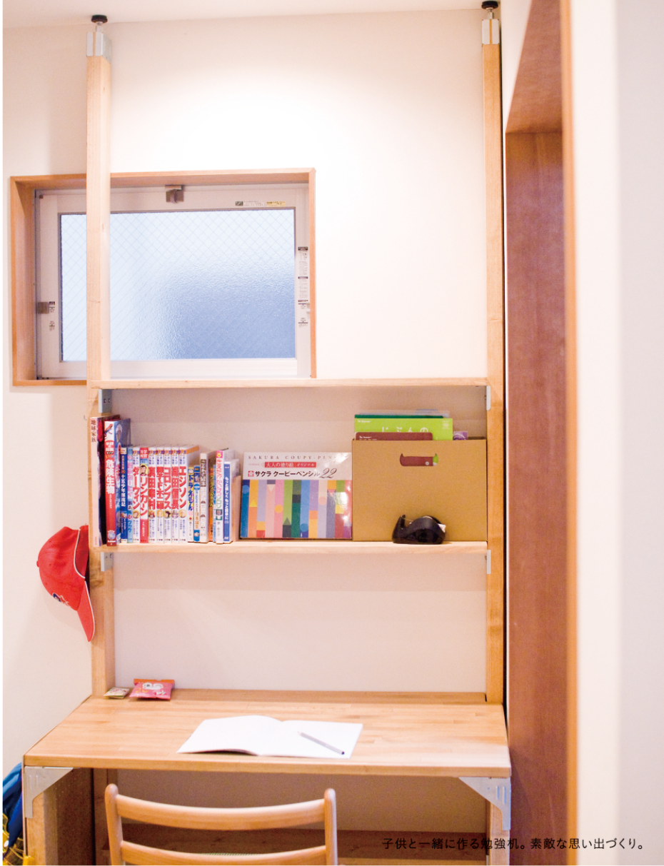
子供と一緒に作る勉強机。素敵な思い出づくり。