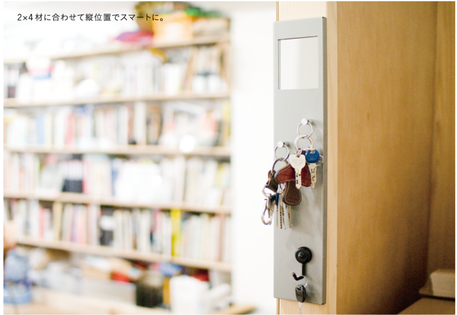
2×4材に合わせて縦位置でスマートに。

M.E. BASE & KEYRING / 1セット M.E. KEYRING / 1コ