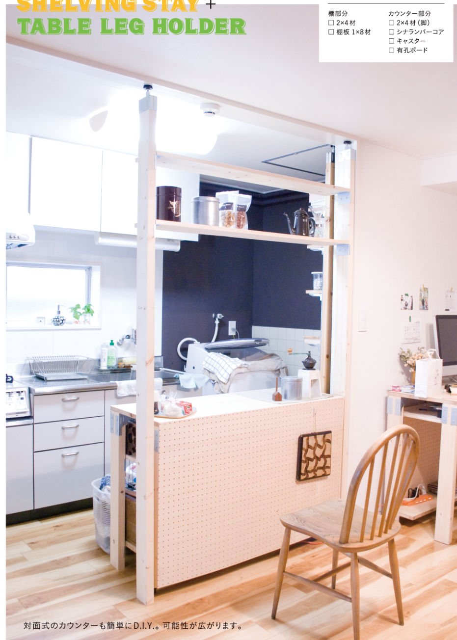
対面式のカウンターも簡単にD.I.Y.。可能性が広がります。