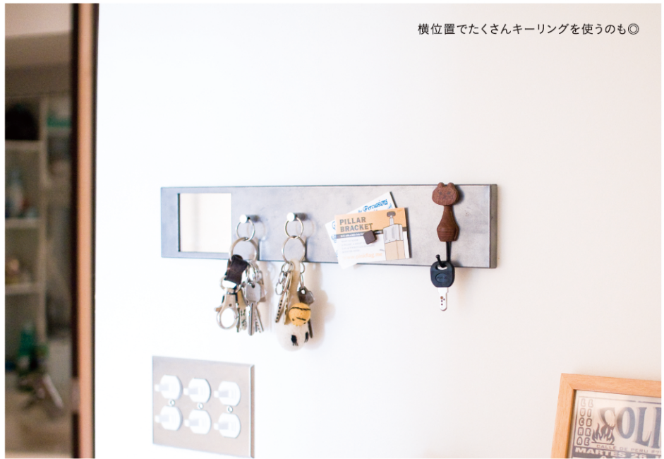
横位置でたくさんキーリングを使うのも◎