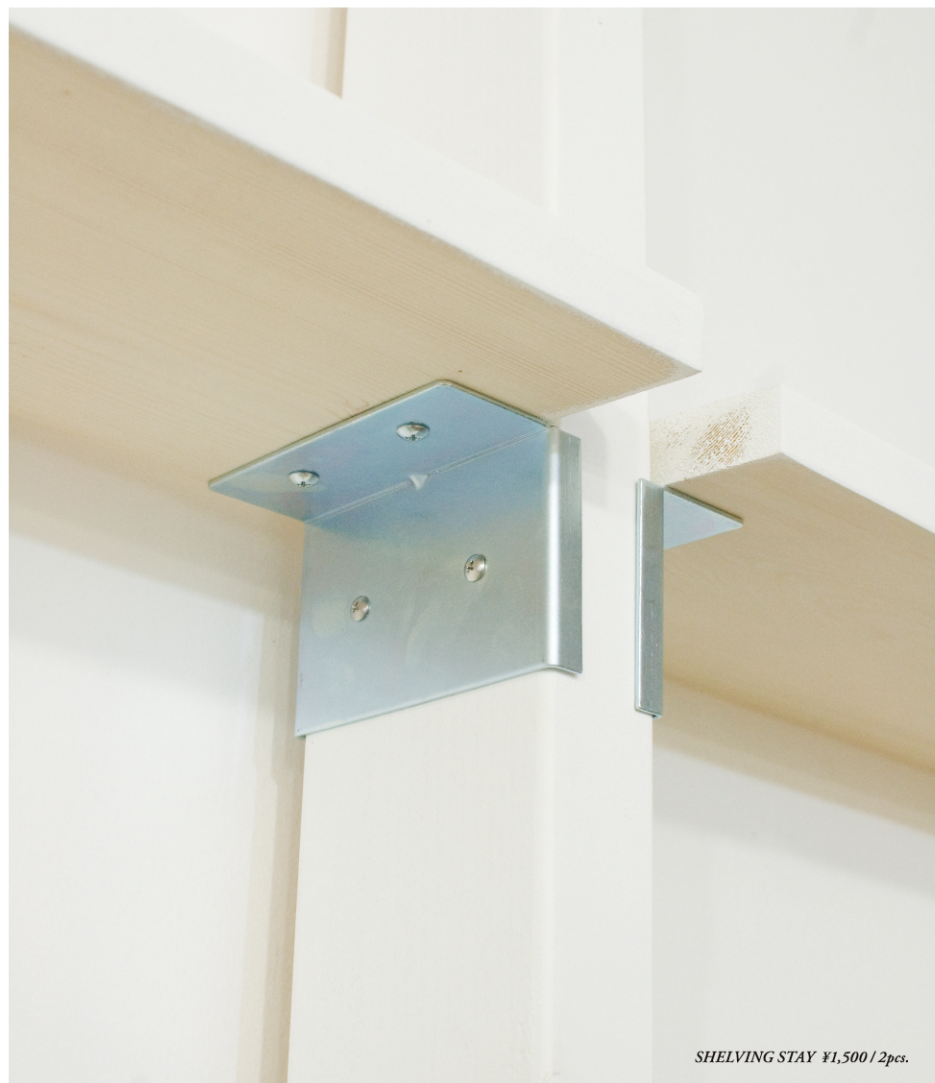
SHELVING STAY ¥1,500 / 2pcs.