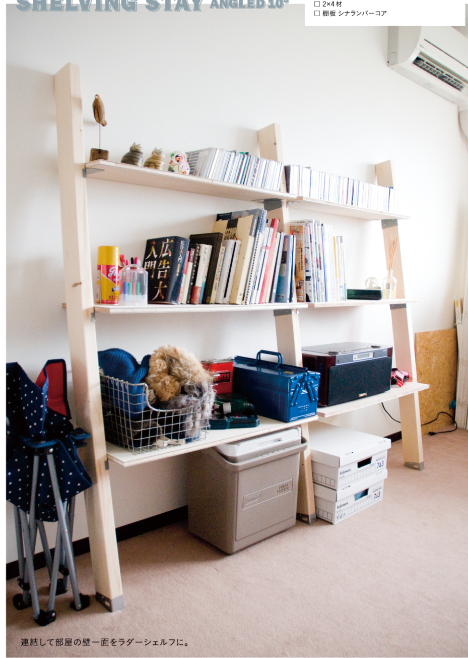
連結して部屋の壁一面をラダーシェルフに。