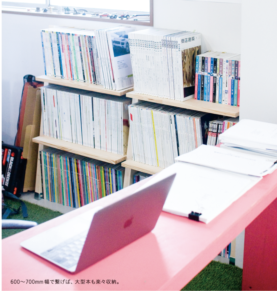
600~700mm幅で繋げば、大型本も楽々収納。