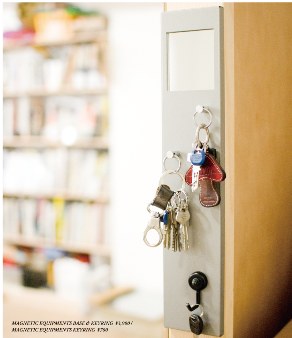
MAGNETIC EQUIPMENTS BASE & KEYRING ¥3,900 / MAGNETIC EQUIPMENTS KEYRING ¥700