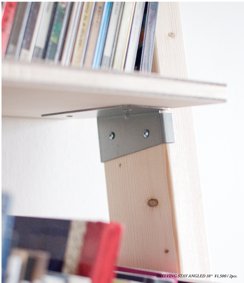
SHELVING STAY ANGLED 10° ¥1,500 / 2pcs.