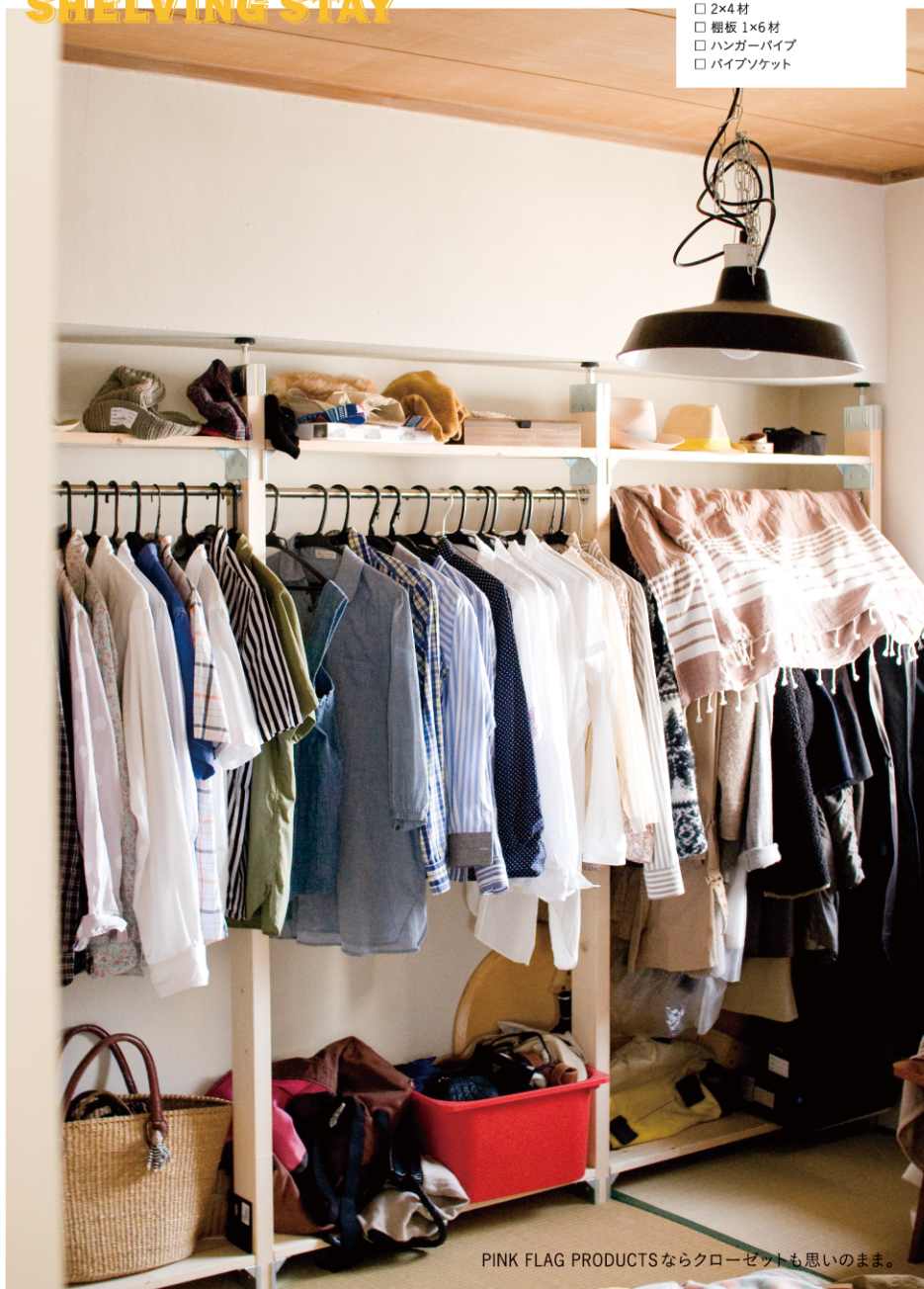
PINK FLAG PRODUCTSならクローゼットも思いのまま。