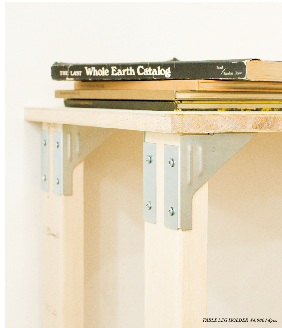
TABLE LEG HOLDER ¥4,900 / 4pcs.