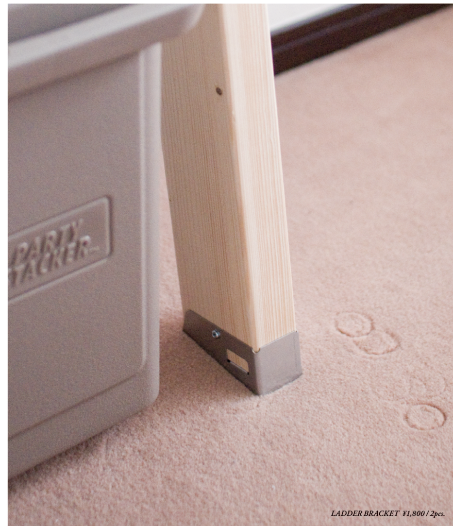
LADDER BRACKET ¥1,800 / 2pcs.